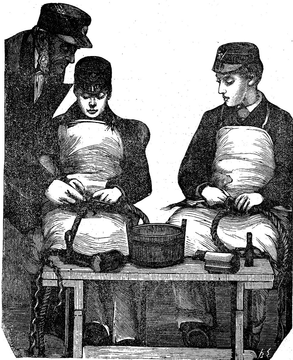
Αἱ Α. Β. Γ. οἱ Πρίγκηπες Ἀλβέρτος καὶ Βίκτωρ υἱοὶ τοῦ Πρίγκηπος τῆς Οὐαλλίας. Λαμβάνοντες τὸ πρῶτον μάθημα ἐπὶ τῆς σχινοπλοκίας.

δίας των νὰ συμμερισθῇ ἡ μία τὰς θλίψεις τῆς ἄλλης. Ὅτε δὲ ἐπανῆλθον εἰς τὴν πόλιν καὶ καθεὶς ἐπορεύθη εἰς τὸ δωμάτιόν του, ὁ μὲν Ἑρμάνν εὔρεν ἀπροσδοκῆτως τὴν φίλην του ἀναμένουσαν αὐτὸν παρὰ τὸ κλειδοκύμβαλον, ὁ δὲ Βάλτερ ἐνθὺ σὺννοος καὶ μελαγχολικὸς εἶχε κλίνει τὴν κεφαλὴν ἐπὶ τῆς μικρᾶς τραπέζης του, ἔνθα ἐντὸς τοῦ πρό πολλοῦ κεκλεισμέ-